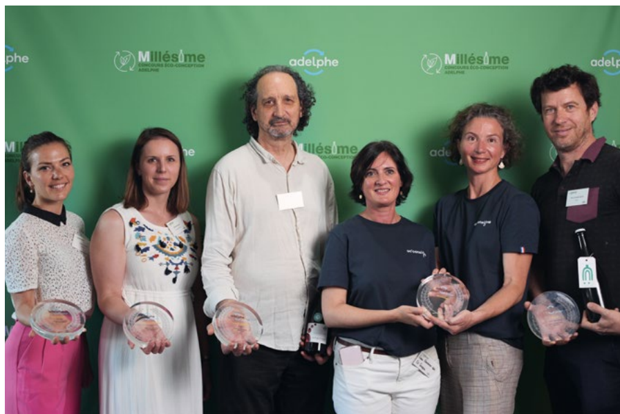
Lauréats Millésime 2024 : EthicDrinks, Joyons, Maison Ventenac, Domaine Le Pech d'André, Oc'Consigne, Champagne Telmont

Depuis la création du concours Millésime en 2020, Adelphe recense plus de 200 participant·e·s, 8 vainqueurs et plus de 10 000 votes du grand public.